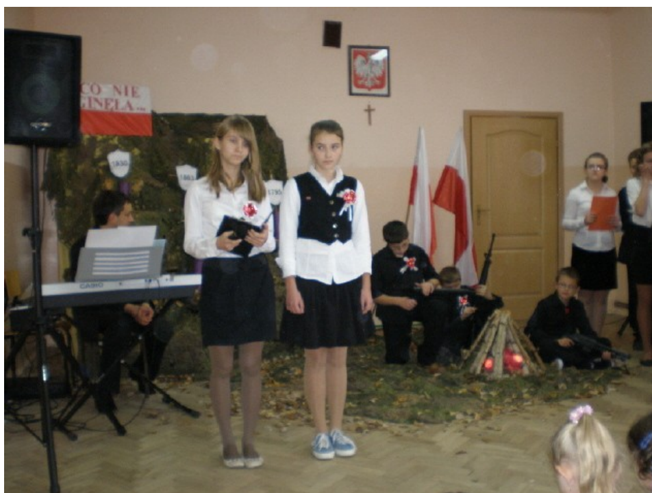
Akademia z okazji Święta Niepodległości