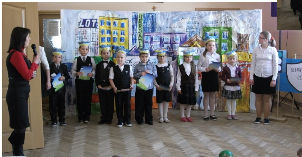
Pasowanie na ucznia przez Panią Dyrektora