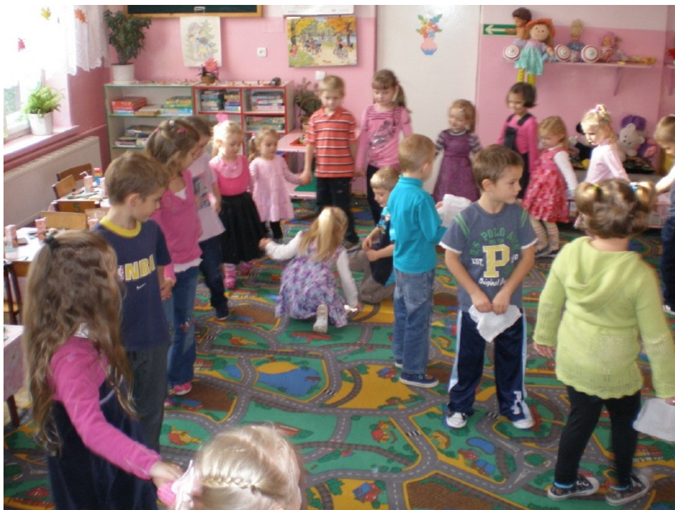
Zabawa w chusteczkę haftowaną

W przedszkolu zabawa andrzejkowa odbyła się 25 listopada. Dzieci wróżyły sobie kim będą w przyszłości oraz jakie rady mają przestrzegać i wiele innych wróżb. Następnie wszyscy bawili się w kaczuszkę, chusteczkę haftowaną oraz tańczyli w parach.