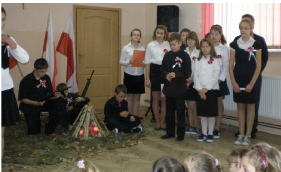
Akademia z okazji Święta Niepodległości