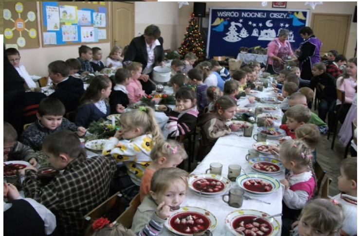
Jedzenie barszczu na wigilii szkolnej