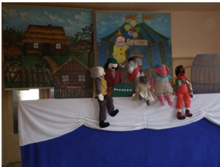
Scena z teatrzyku „Tomcio”

2 listopada do naszej szkoły przyjechał teatrzyk pt. „Tomcio”. Przedstawiał on nam „Bajkę o szczęściu”, która mówiła nam o tym, że w życiu nie jest najważniejsze to co się posiada, ale przyjaźń i miłość. Podczas teatrzyku wiele się dowiedzieliśmy o tym, jak ważna jest przyjaźń. Głównym bohaterem był gospodarz i jego zwierzęta. Gospodarz oddał swoją myszkę, świnkę i kogucika za mało cenne rzeczy i dopiero po ich stracie dowiedział się, jak byli oni dla niego ważni. Na szczęście los mu sprzyjał i odnalazł swoich przyjaciół. Teraz wszyscy wiemy, że w życiu przyjaźń jest najważniejsza.