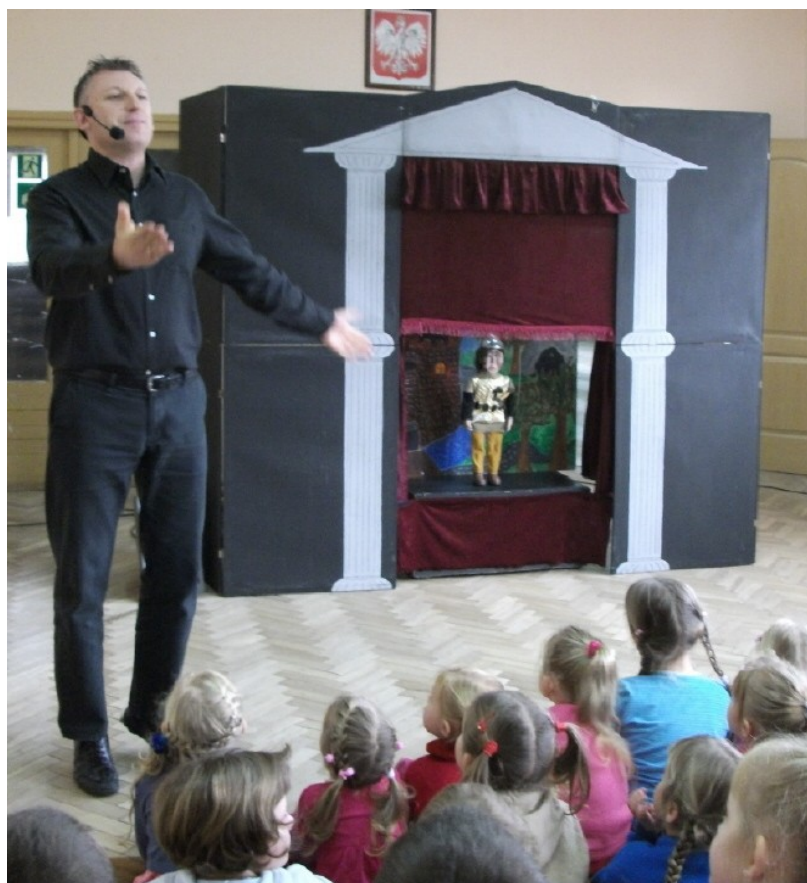
Prowadzący przedstawienie, scena