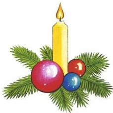
Opr. Ola Synowiecka