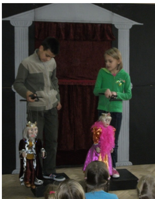
Uczniowie uczący się poruszać kukielkami