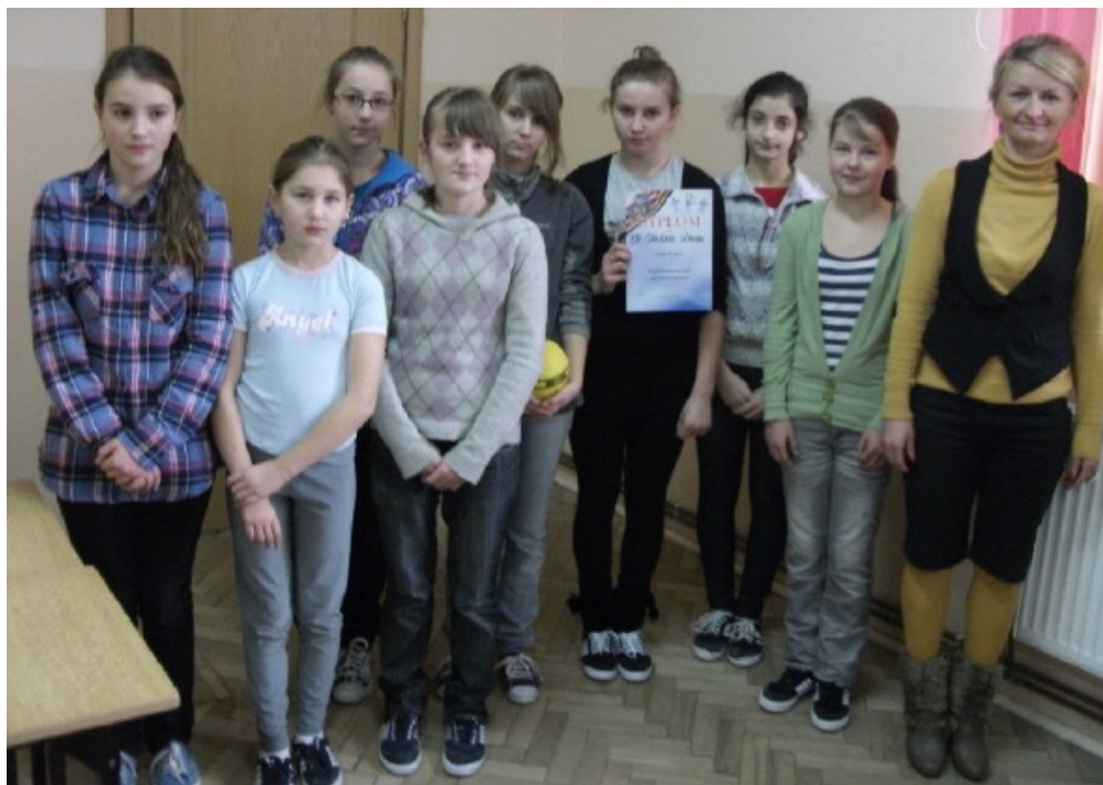
Drużyna dziewczyn – I miejsce w Piłce Ręcznej

Dnia 19 listopada 2011r. w Szkole w Siedliskach Bogusz odbyły się między szkolne zawody w piłkę ręczną . W tych zawodach brało udział 5 szkół w tym nasza. Gra była bardzo zacięta. Każdy chciał zdobyć, jak najlepsze miejsca. Z informacji od grupy grającej wiemy, że było bardzo ciężko. Pomimo trudów i wysiłków grupa dziewczyn zajęła I miejsce spośród innych równie dobrze grających zawodniczek. W nagrodę dziewczyny dostały dyplom oraz piłkę do gry w piłkę ręczną.