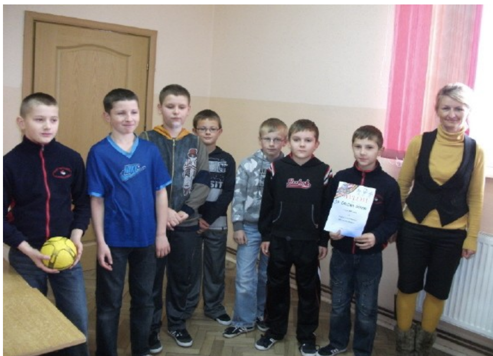
Drużyna chłopców – III miejsce w Piłce Ręcznej