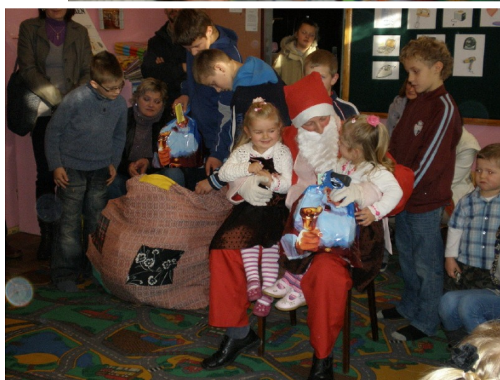
Rozdawanie prezentów przez Mikołaja