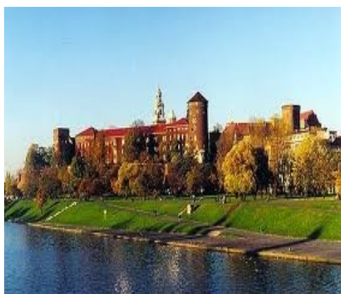
Zamek na Wzgórzu Wawelskim